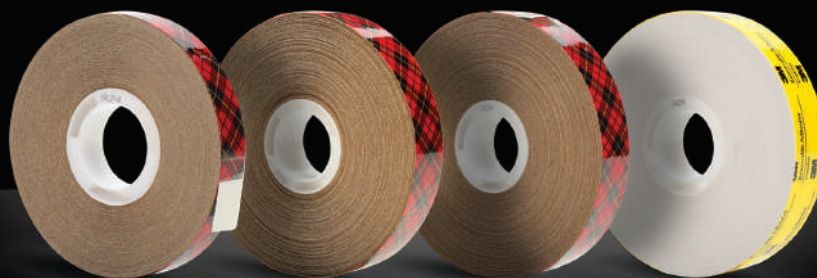
Le ruban transfert Scotch® ATG 924